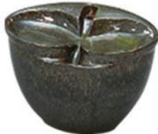
5、アボカドグリーン