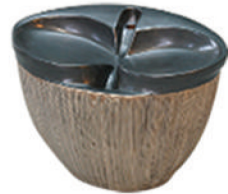
6、ストライプベージュ&ブラック