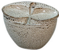
2、アイボリーベージュ